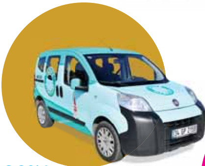
S.20'de Cenaze ve Taziye Hizmetleri