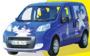
S.18'de Beyaz Zambak