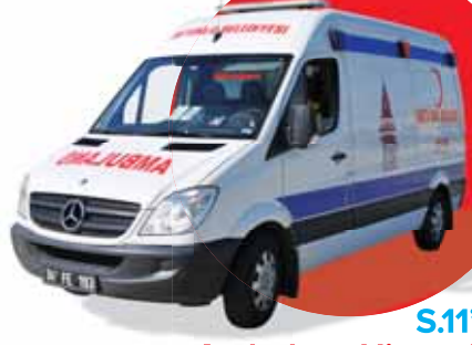
S.11'de Ambulans Hizmetleri