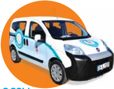
S.22'de Veteriner Hizmetleri