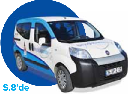
S.8'de Sağlık Taraması